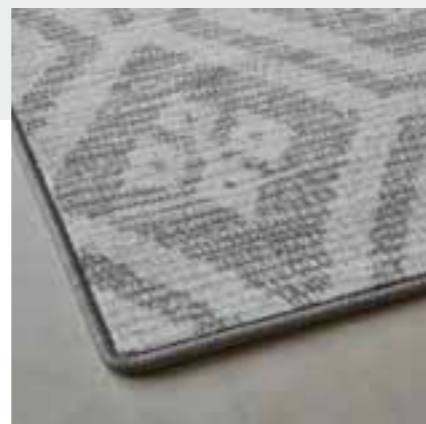
Festonneren / Surjet / Kettelung / Overedging