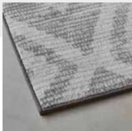
Blindband/ Gallon invisible / Blindband / Blind band